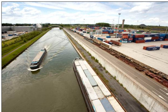
Nouvelle ligne port de Dourges

Suivant des données provisoires sur les cinq premiers mois 2010, le transport fluvial enregistre un niveau d'activité cumulée de 3,26 milliards de t-km, ce qui correspond à une augmentation de + 8,3 % par rapport à l'exercice précédent. La croissance reste donc soutenue , malgré un ralentissement de la croissance sur le mois de mai (NB : la hausse était de + 14,9 % sur les 4 premiers mois)