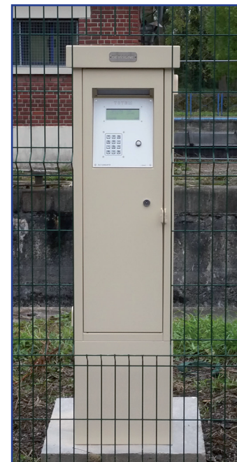
Totem de l'écluse de Denain