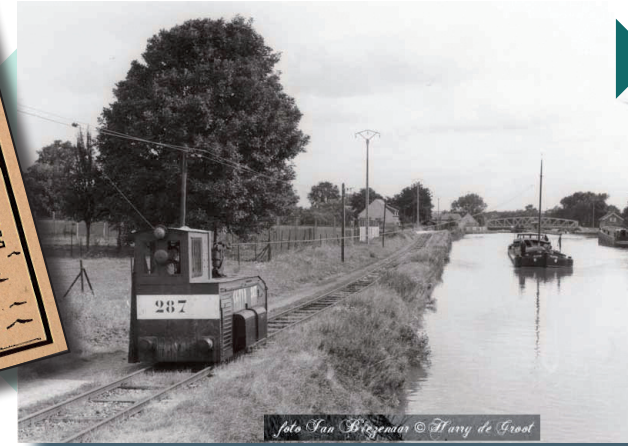
Locomotive de la Compagnie Générale de Traction sur les Voies Navigables