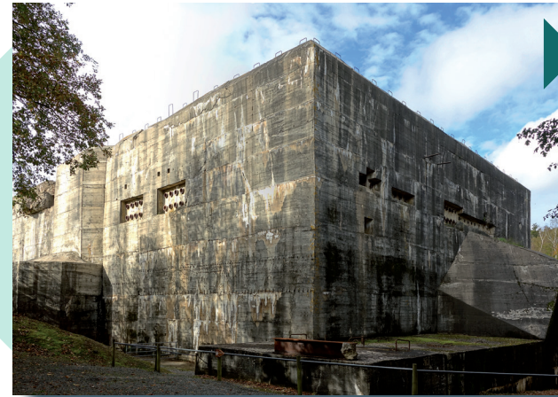
Le blockhaus d'Éperlecques a servi de base de lancement aux missiles V2 visant Londres et le Sud de l'Angleterre. Classé monument historique depuis 1986, il est ouvert au public : http://www.leblockhaus.com/

VNF préserve nos patrimoines historique et naturel