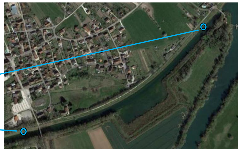
Pontons d'Heuilley sur Saône PK 256.5 Remplacement des planches bois dégradées par des caillibottis en résine - coût d'investissement 1 000 € TTC En cours de réalisation