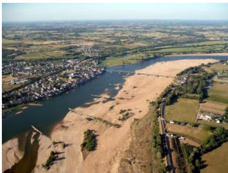
Figure 1: Vue des épis en face du bourg d’Ingrandes-Le Fresne sur Loire

Nantes, le 27 août 2021 – Suite à l’avis favorable sans réserve de la commission d’enquête publique rendu le 7 juin 2021, et à l’autorisation environnementale délivrée le 2 août 2021 par les préfets de la Loire-Atlantique et du Maine-et-Loire, les premiers travaux pour le rééquilibrage du lit de la Loire doivent débuter à partir du 1er septembre 2021, en commençant par le secteur d’Ingrandes/Montjean-sur-Loire dans le Maine-et-Loire. Sur ce secteur, les travaux consisteront à abaisser et à raccourcir 23 épis de navigation, pour donner à la Loire plus d’espace de mobilité. Le montant des travaux sur ce secteur est de 1,9 M€, cofinancés par l’Agence de l’eau Loire-Bretagne (45%), la Région des Pays de la Loire (30%), les fonds européens (20%) et VNF (5%).