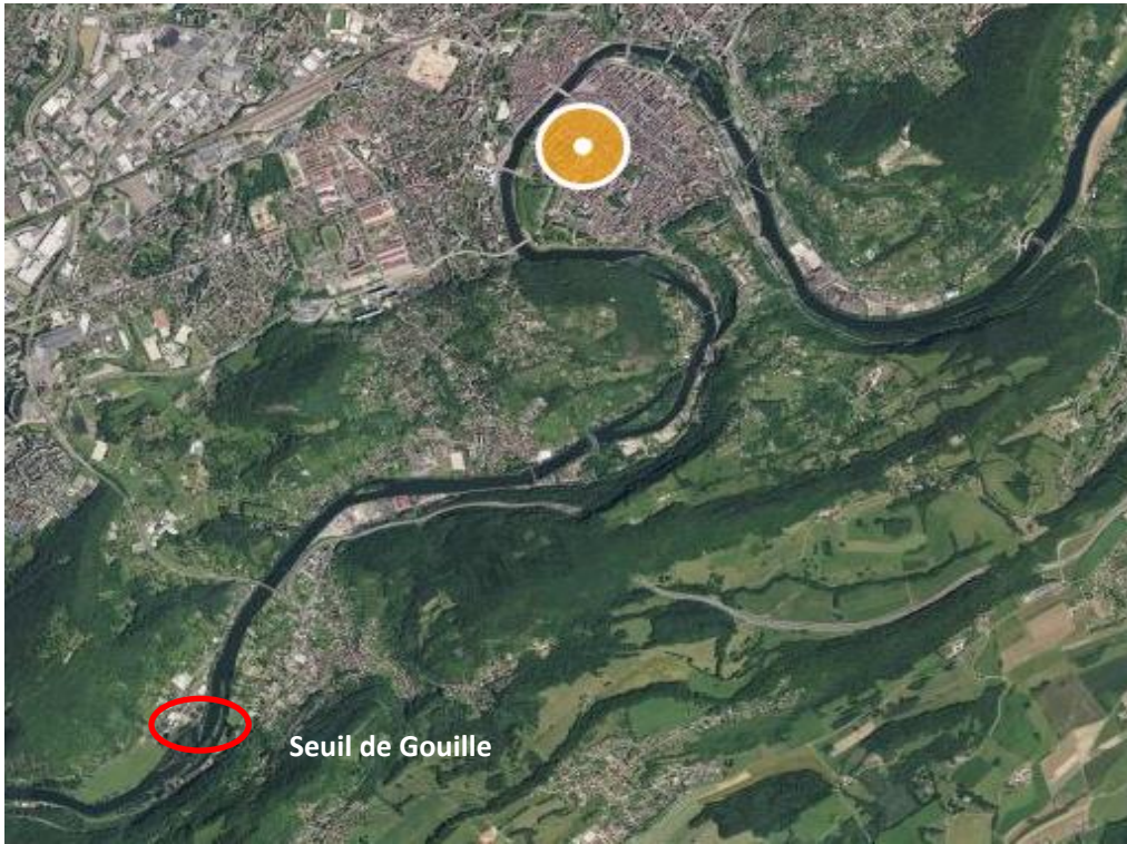
Seuil de Gouille