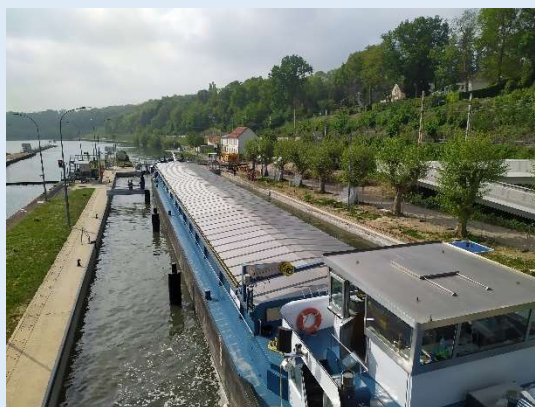
Premier passage de bateaux dans l'écluse rénovée

L'opération, d'un montant de 6 millions € TTC, a été cofinancée par l'Europe, la région Ile de France et le plan de relance. Le groupement VCMF-ROUBY a assuré la réalisation des travaux et la maîtrise d'œuvre a été suivie par le groupement BIEF-IOA-CARICAIE.