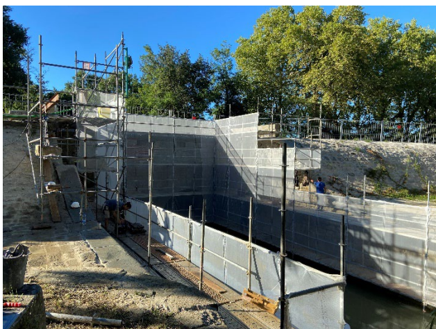
Dernière phase de travaux en octobre 2022