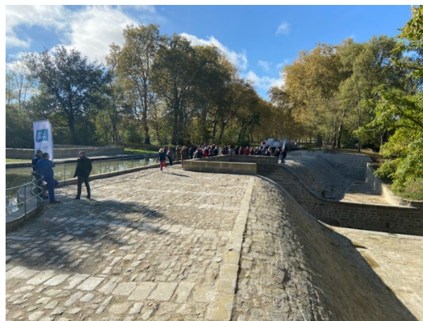
Visite commentée des travaux avec vue sur les déversoirs