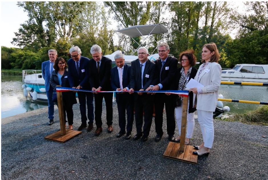
Symboliquement, le ruban est coupé par les co-financiers et élus présents pour inaugurer la station de dépotage, située au port de Buzet-sur-Baïse.

Accessible à tout moment et utilisable par tous, le service de dépotage peut être piloté depuis une plateforme internet dénommée Useo et qui permettra aux usagers de comprendre l'utilisation du dispositif.