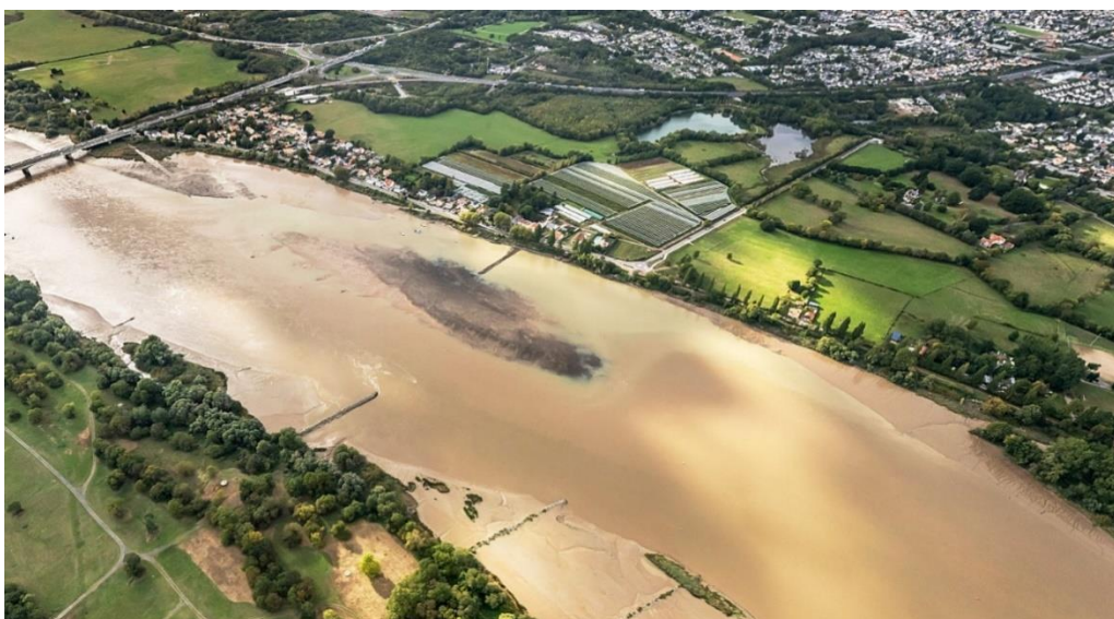
Figure 1 : Vue aérienne du secteur de Bellevue

Voies navigables de France entame les travaux principaux du secteur de Bellevue. Après les travaux préparatoires réalisés à Saint-Julien-de-Concelles en 2023 visant à réaliser une estacade et un site de stockage, les travaux principaux du secteur dit « de Bellevue » (secteur de Saint-Julien-de-Concelles / Sainte-Luce-sur-Loire) ont commencé le 1 er juillet 2024. Situés dans la zone la plus en aval du projet, ces travaux sont la clé de voûte du programme de rééquilibrage du lit de la Loire. En parallèle, le remodelage des épis de navigation se poursuivra entre Ancenis et Oudon à partir de mi-août, en fonction des conditions hydrologiques.