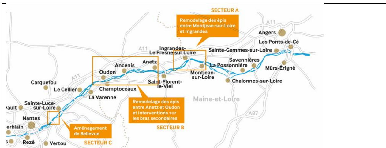
Figure 3 : Localisation des 3 secteurs d'intervention

Tout au long du 19 ème et du 20 ème siècle, la Loire estuarienne a en effet été fortement modifiée par la navigation, l'extraction du sable et les activités humaines, qui ont perturbé les équilibres et le fonctionnement naturel du fleuve. De Nantes aux Ponts de Cé, le lit de la Loire s'est ainsi profondément enfoncé, entraînant des niveaux d'eau de plus en plus bas en période d'étiage (lorsque les débits du fleuve sont les plus faibles), se déconnectant au fil du temps de ses bras secondaires et perturbant durablement sa dynamique et la biodiversité.