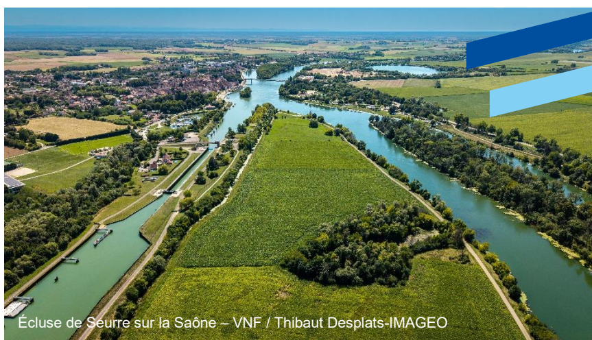
Écluse de Seurre sur la Saône